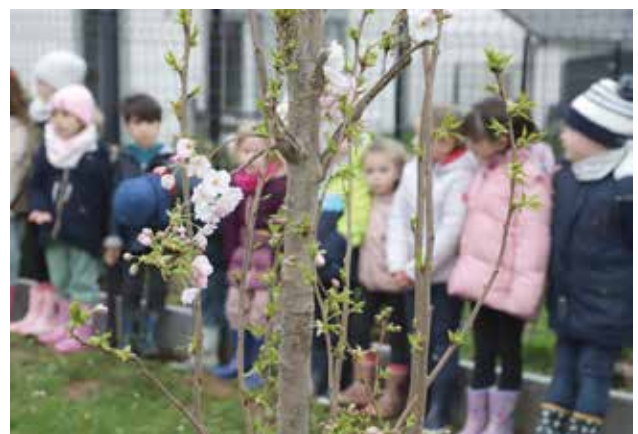
La Municipalité a souhaité que les enfants de l'école Anne-Frank (grande section) participent à ces plantations