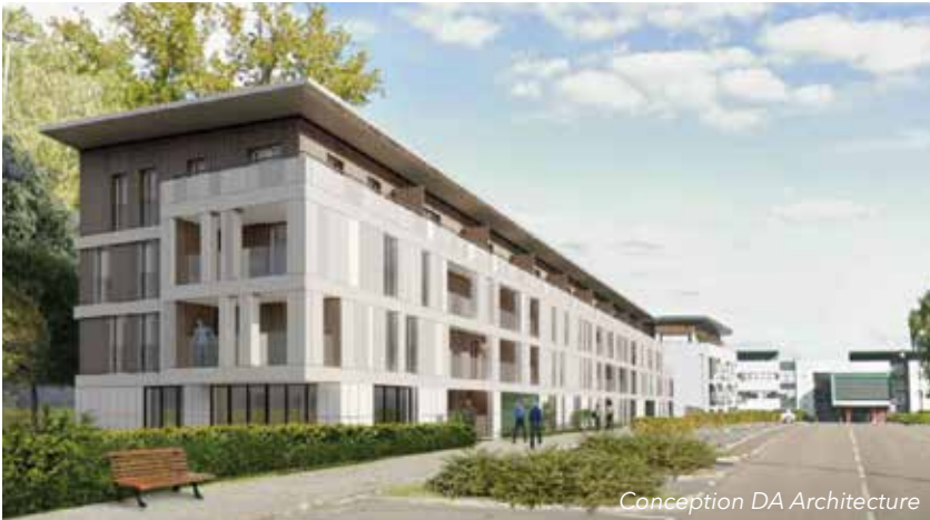
Conception DA Architecture

Ces décisions visent à garantir la sécurité des riverains, des piétons et des usagers de la route. Bien consciente des désagréments occasionnés, la mairie vous recommande d'éviter ce secteur dans la mesure du possible et d'utiliser au mieux les aires de stationnement en périphérie des établissements publics et scolaires. Merci pour votre compréhension.