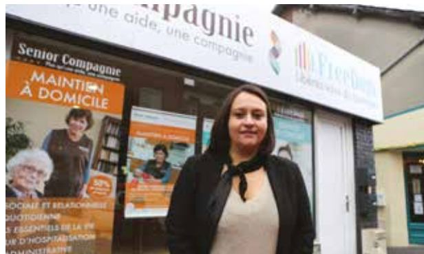
FREE DOM / SENIOR COMPAGNIE 86 rue Jean Jaurès

Ouvert le Lundi de 13h30 à 17h00 et du Mardi au Vendredi de 9h00 à 12h30 et de 13h30 à 17h00 (fermeture le Mercredi). Tél. 03 27 39 12 41