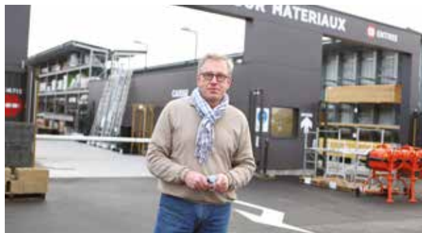
BRICOMARCHÉ Rue la Fontaine

Ouvert le Lundi de 13h30 à 17h00 et du Mardi au Vendredi de 9h00 à 12h30 et de 13h30 à 17h00 (fermeture le Mercredi)