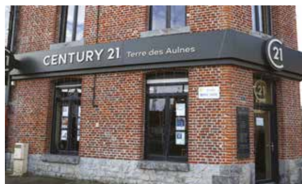
CENTURY 21 TERRE DES AULNES 21 place Serge Juste

Ouvert du lundi au vendredi De 9h à 12h et de 14h à 19h et le samedi de 9h à 12h30 et de 14h à 19h. Tél. 03 27 58 25 40