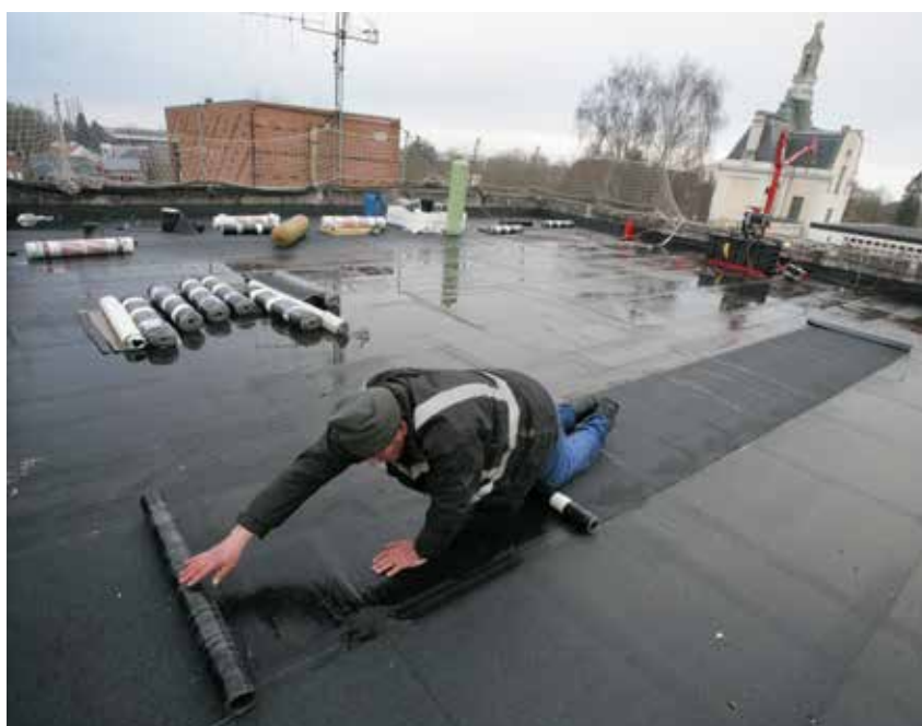
Les travaux d'isolation et d'étanchéité de la toiture du centre administratif : un choix budgétaire qui répond à un besoin urgent

Une maîtrise budgétaire qui permet à Aulnoye-Aymeries de continuer sa mutation.