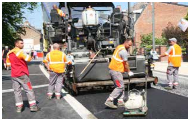
Le chantier a duré 15 mois pour un coût d'un peu plus de deux millions d'€ TTC.

Il aura fallu sept longues années entre l'instruction du dossier et les demandes de subvention auprès du Département et de l'Agglo.