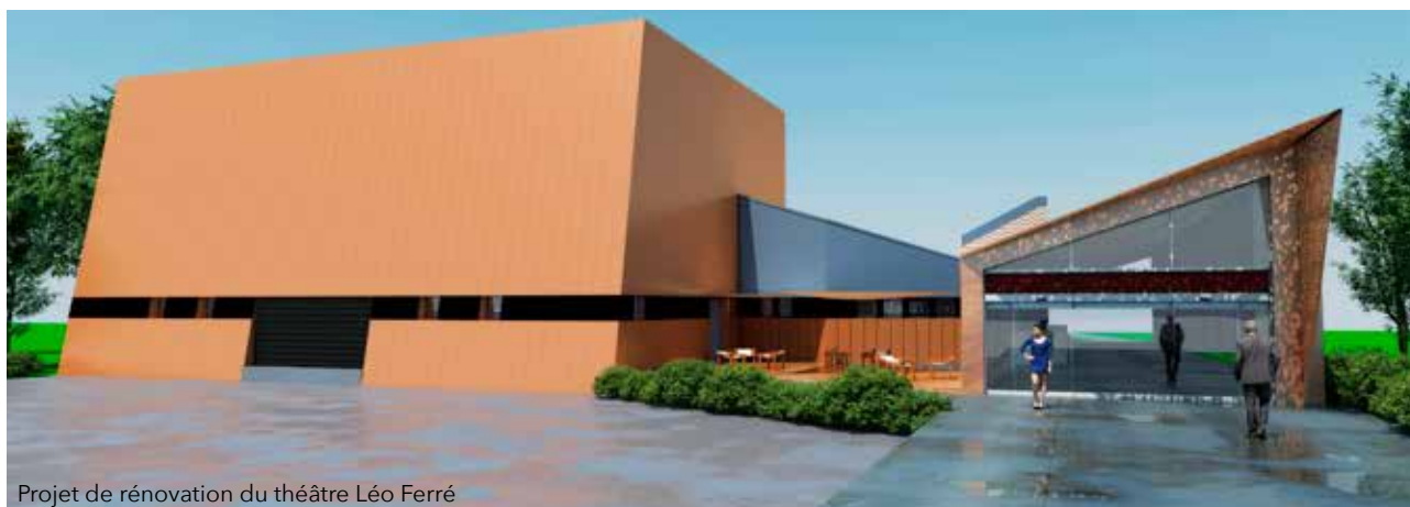
Projet de rénovation du théâtre Léo Ferré

C'est la rénovation urbaine des esprits et des corps.