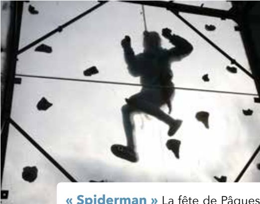
« Spiderman » La fête de Pâques de la Maison de la Petite Enfance, une après-midi de détente pour les familles