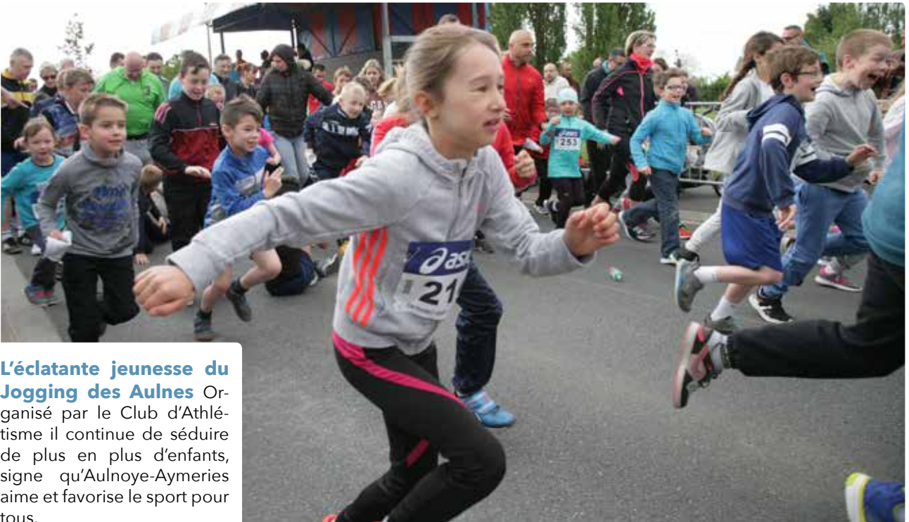
L'éclatante jeunesse du Jogging des Aulnes Organisé par le Club d'Athlétisme il continue de séduire de plus en plus d'enfants, signe qu'Aulnoye-Aymeries aime et favorise le sport pour tous.