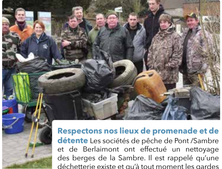
Respectons nos lieux de promenade et de détente Les sociétés de pêche de Pont /Sambre et de Berlaimont ont effectué un nettoyage des berges de la Sambre. Il est rappelé qu'une déchetterie existe et qu'à tout moment les gardes fédéraux peuvent dresser des PV !