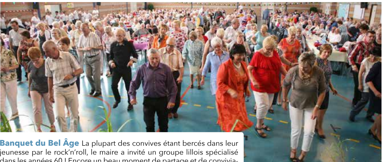
Banquet du Bel Âge La plupart des convives étant bercés dans leur jeunesse par le rock'n'roll, le maire a invité un groupe lillois spécialisé dans les années 60 ! Encore un beau moment de partage et de convivialité qui a fait le bonheur de nos aînés.