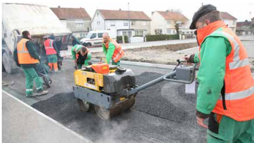
Une vingtaine de nouvelles places de stationnement au pied du château d'eau