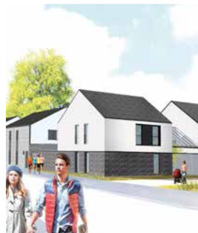
Nouveaux logements rue Mirabeau