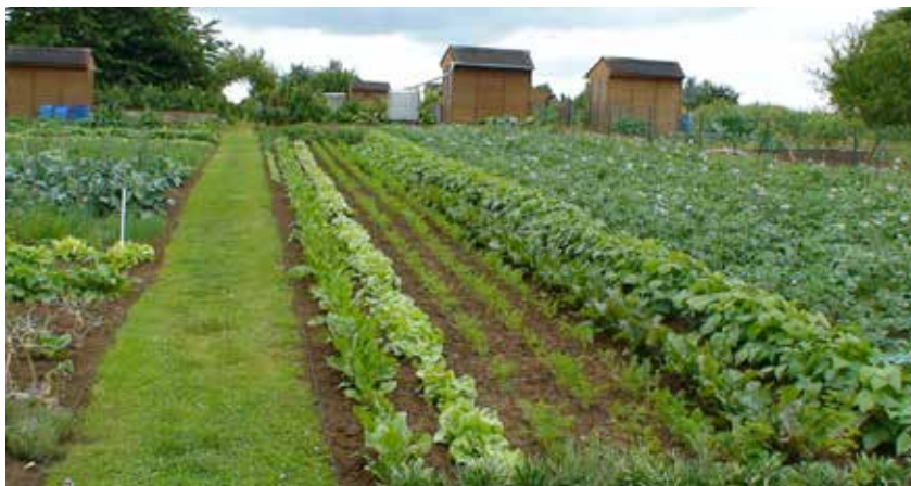
Un exemple de ce qui devrait être les jardins familiaux et solidaires du « Chemin noir » et du « Campin ».

Renseignements et inscriptions Service urbanisme en mairie Tél. 03 27 53 63 84