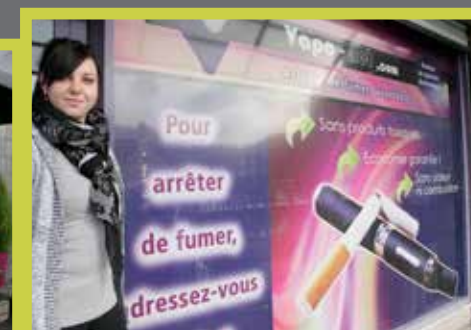
Vapo-net cigarettes électroniques - 46 rue Jean Jaurès. Ouverture le 6 novembre 2014 (anciennement Eglantine)