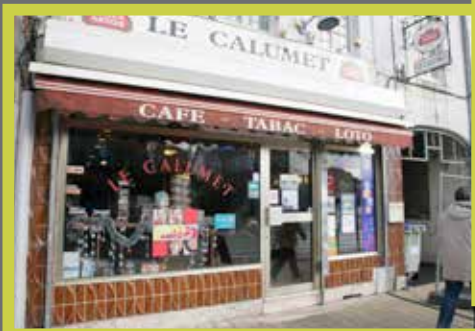
Café-Loto-Tabac Le Calumet - 64 rue Jean-Jaurès Repris en juillet 2014 par Romain Delvigne

pour ne pas être en reste, se sont lancés dans la rénovation de leur façade.