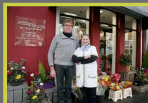
Warin fleurs - 3 rue de l'Hôtel de Ville Façade rénovée en octobre 2014