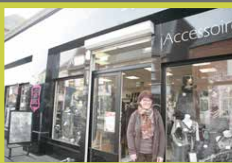
Tricyandre / Prêt à porter et accessoires 13 rue Jean Jaurès Façade rénovée en octobre 2014