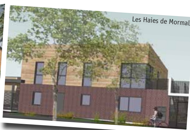
Les Haies de Mormal