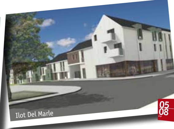
Ilot Del Marle