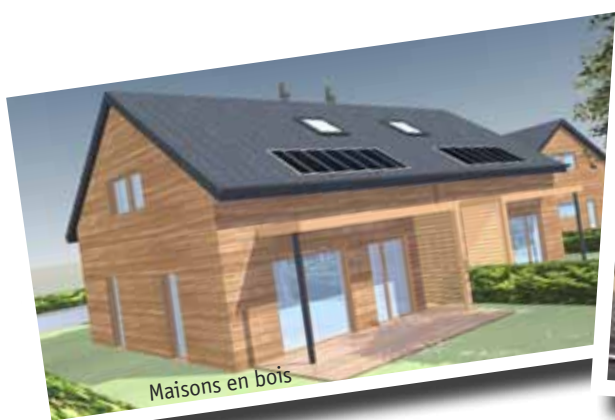
Maisons en bois

Aujourd'hui, plusieurs dispositifs existent pour faciliter l'accession à la propriété. Le PTZ+ (Prêt à taux zéro) qui remplace le Pass'Foncier, le PTZ et le crédit d'impôt sur les intérêts d'emprunt. Le PTZ+ concerne désormais les familles gagnant 4 fois le SMIC. La Loi Scellier offre également de nombreux avantages tout comme le PSLA (Prêt social location - accession). Quelque soit votre situation, une solution vous correspond. N'hésitez pas à contacter les différents porteurs de projets dont le téléphone est mentionné si dessus. Ils sauront vous renseigner. Plus d'informations sur www.aulnoye-aymeries.fr