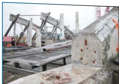
Le Pont de ciment a tiré sa révérence Lire en page 3

www.aulnoye-aymeries.fr La Mairie sur internet dès le 16 janvier 2009