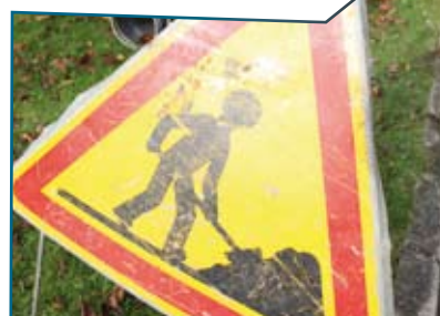
La ville en chantier Lire en page 4 et 5

Le Maire et le Conseil Municipal vous souhaitent de bonnes fêtes de fin d'année et vous invitent à la cérémonie des vœux, vendredi 16 janvier 2009, à 18h30, à la salle des sports Jean Lempereur