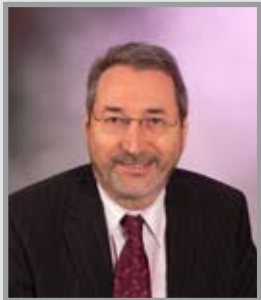
Bernard Baudoux Maire d'Aulnoye-Aymeries